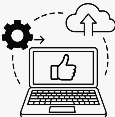
Gebruiksklaar maken en back-up

€ 80,- excl. btw Gebruiksklaar maken (1 gebruiker)