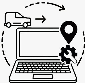
Service op locatie

€ 150,- Bezorgen en aansluiten 2 gebruikers / tot 2 uur (extra tijd € 70,- per uur)